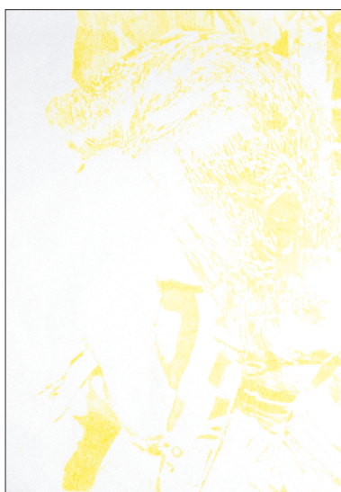
Guillaume Millet, Scènes de genre , 2004 Crayon de couleur, 60 x 42 cm

Guillaume Millet dissocie des techniques et approches qui peuvent laisser supposer qu'elles émanent de créateurs différents. D'un côté, des acryliques sur toiles de format carré réduites à une bichromie noir / blanc. De l'autre, des dessins à la mine de plomb, au crayon de couleur et carbone sur papier. Les peintures répondent à une configuration formelle et technique qui leur donne un aspect hard edge tandis que les dessins au trait plus fragile et hésitant témoignent d'une absence de raideur qui leur confère une apparence incontestablement plus désorganisée. Les unes comme les autres relèvent néanmoins d'un même état d'esprit, l'artiste cherchant tout simplement mais par le biais de mécanismes différents, voire divergents, à interroger le processus de représentation.